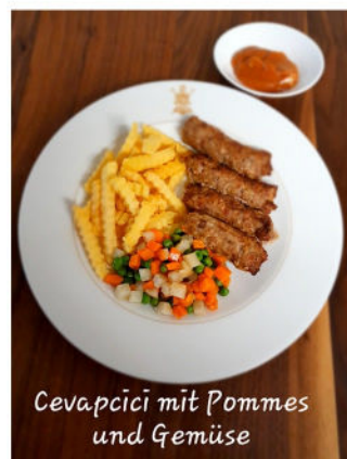
Cevapcici mit Pommes und Gemüse

Haferflockensuppe Cevapcici mit Kartoffeln, Gemüse und Roter Rübensalat Apfelmus