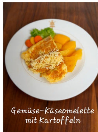
Gemüse-Käseomelette mit Kartoffeln

Eintropfsuppe Gemüse-Käseomelette mit Kartoffeln und Fisolensalat Beerenjoghurt