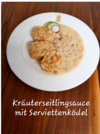
Kräuterseitlingsauce mit Serviettenködel

Wurzelgemüsesuppe Kräuterseitlingsauce mit Serviettenknödel und Grünem Salat Krokantcreme