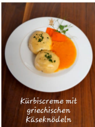
Kürbiscreme mit griechischen Käseknödeln

Haferflockensuppe Kürbiscreme mit griechischen Käseknödeln und Roter Rübensalat Apfelmus