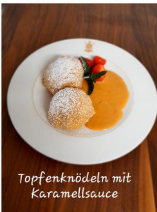
Topfenknödeln mit Karamellsauce

Eintropfsuppe Topfenknödeln mit Obstgarnitur Karamellsauce