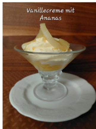
Vanillecreme mit Ananas