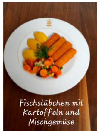
Fischstäbchen mit Kartoffeln und Mischgemüse

Käsecremesuppe Fischstäbchen mit Kartoffeln, Mischgemüse und Linsensalat Vanillecreme m. Ananas